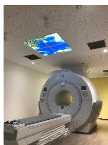
某脳神経外科院様